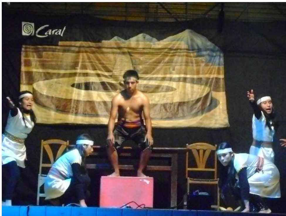
Figura 4. I Festival de Teatro y Declamación “Forjando Identidad Cultural Local”