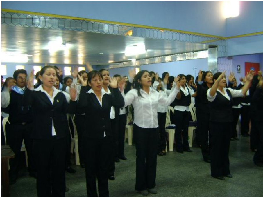
Figura 2. Taller “Forjando Identidad Cultural de Barranca”